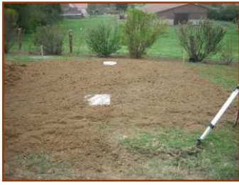
Création d'une filière d'assainissement non collectif regroupée (30 EH)

fosse toutes eaux 8000 l + poste de relevage