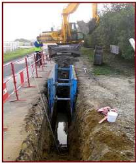
Pose d'un collecteur sous accotement

11 dispositifs individuels d'assainissement non collectif et 1 dispositif regroupé