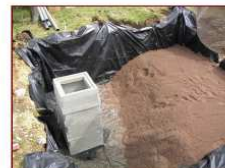
Mise en place du sable filtrant