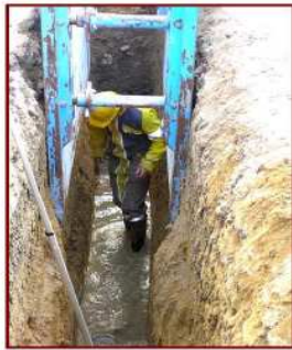
Pose d'un collecteur sous chemin stabilisé