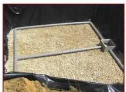
Tuyaux de collecte (fond du filtre à sable)