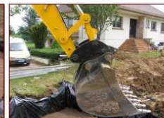
Mise en place du sable