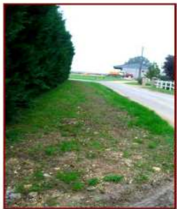
Réfection de l'accotement