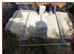
Tuyaux d'épandage (partie supérieure du filtre à sable)