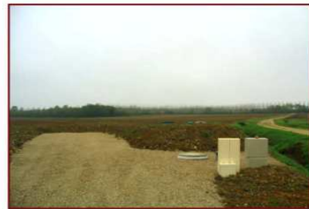
Entrée du site de traitement (Filière d'assainissement autonome regroupé : fosse toutes eaux + filtre à sable + poste de relèvement)