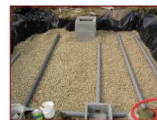
Pose des tuyaux d'épandage