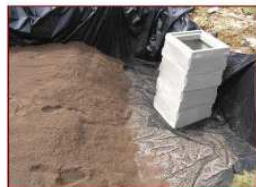
Mise en place du sable filtrant