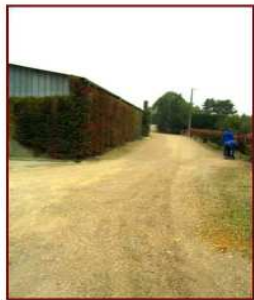
Réfection du chemin stabilisé