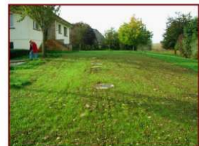
Situation après travaux