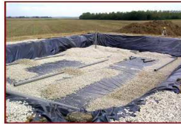
Pose des tuyaux de collecte (partie inférieure du filtre à sable)