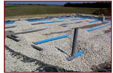
Pose des tuyaux d'épandage (partie supérieure du filtre à sable)