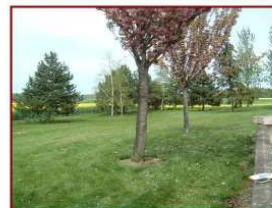
Situation avant travaux