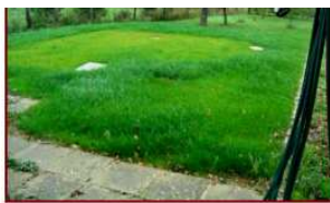
Situation après travaux